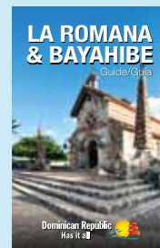
Our cover / Nuestra portada: St. Stanislaus Church in Altos de Chavón