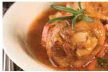
Pollo Guisado Stewed chicken in a tomato, onion, garlic, olives, capers and cilantro sauce.