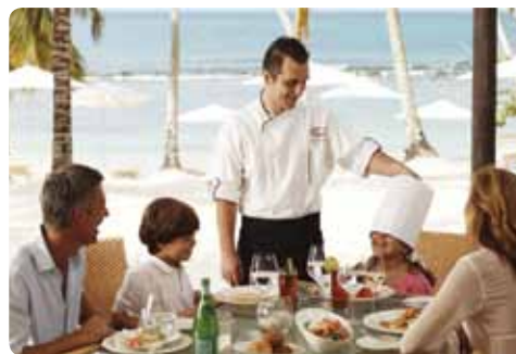
Le Cirque Restaurant at Playa Minitas

Casa de Campo's beach with all the comforts of the resort and vacation community. It is also famous for its restaurant, The Beach Club by Le Cirque, of the Maccioni family, owners of Le Cirque Restaurant in New York.