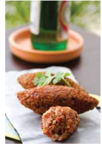
Quipes Deep-fried bulgur rolls filled with beef and spices.