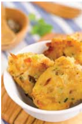
Arepitas Dominican meals frequently come with these cassava fritters.