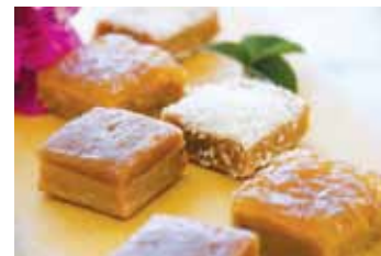
Dulces criollos Made with sweetened milk and fruit.

Check out the recipes for these dishes at dominicancooking.com where you can buy Aunt Clara's Dominican Cookbook, an excellent reference with 100 traditional Dominican recipes; fully illustrated with beautiful color photography. Las recetas de estas sugerencias están en cocinadominicana.com , donde también puede comprar el libro-recetario de la Tía Clara.