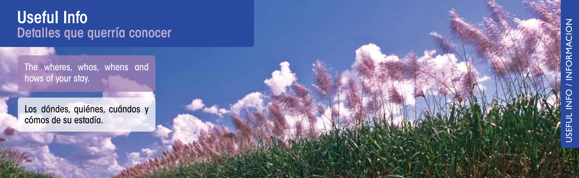
Sugar cane fields in bloom

Los dónde, quiénes, cuándo y cómo de su estadía.