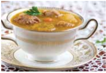
Sancocho Stew with different meats and vegetables. Also red bean and pigeon pea versions.