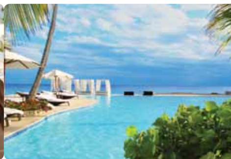
Viva Wyndham Resort Dominicus

La playa pública de la ciudad de La Romana puede ser bulliciosa los fines de semana pero