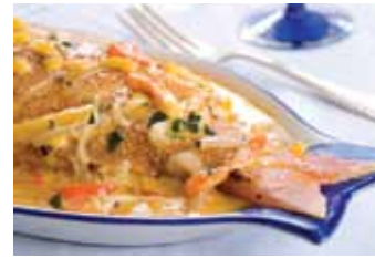
Pescado con coco Fresh fish with red bell peppers and onions in a coconut milk-based sauce.