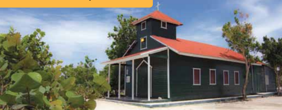
Divina Pastora Church

The community has organized a tour of the town that highlights craftsmanship, cuisine and regional culture. It begins at the Divina Pastora Church built in 1925 that retains its wooden structure and original design. On the premises, see the national flower, the Rose of Bayahibe, found originally in Bayahibe.