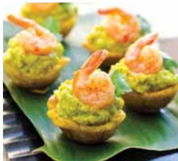
Mofonguitos Fried plantain baskets stuffed with avocado and shrimp.