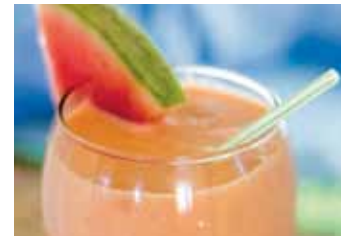
Batida de lechoza Dominican fruit shake made with papaya, milk, vanilla, ice and sugar.