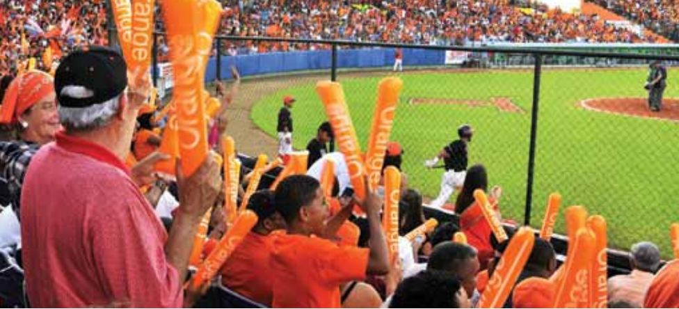
Los Toros baseball game fans