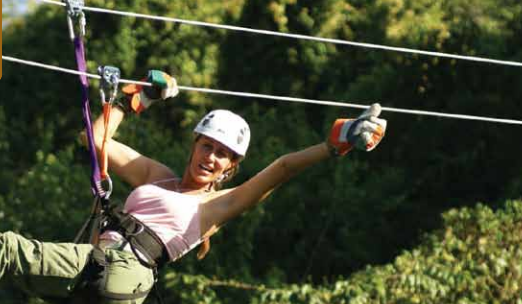
Wild Ranch Canopy