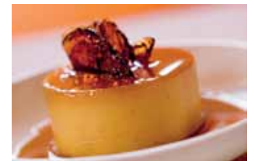
Flan de leche Crème caramel – popular dessert in the DR, made with eggs, milk and sugar.