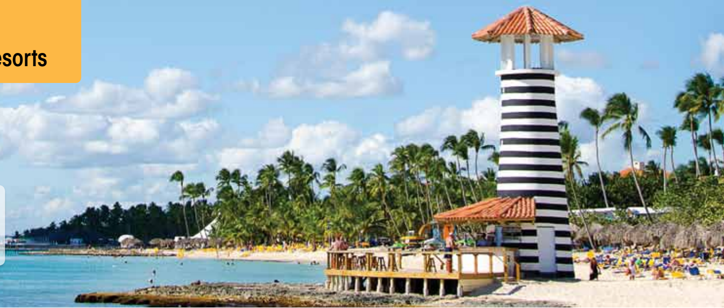
Lighthouse-bar at beachside Iberostar Hacienda Dominicus