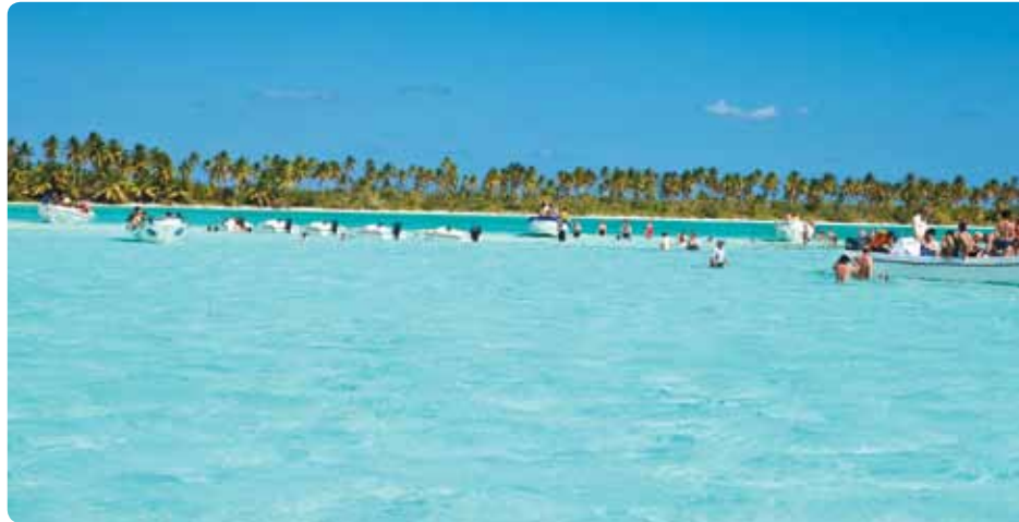
Museo Captain Kidd, Isla Catalina