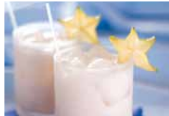
Morir Soñando "To die dreaming". Sweet shake made with evaporated milk, orange juice, ice and sugar.